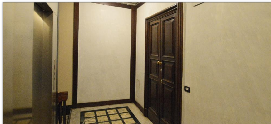
Accesso al piano